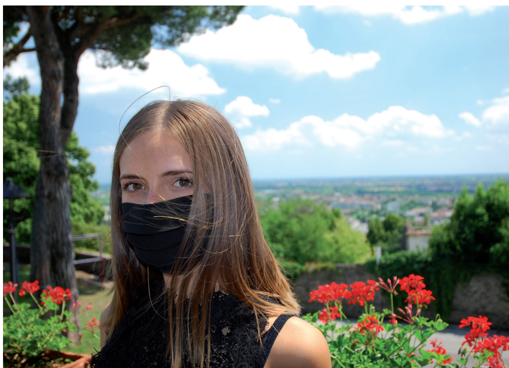
LE MASCHERINE SI RIVOLGONO A UN AMPIO TARGET: NE ESISTONO DIVERSI MODELLI

L'attualità è stata, dunque, semplicemente un trampolino di lancio: Mandarin è una fucina di idee in continua evoluzione, lanciata verso il futuro. I suoi progetti nascono sempre dalle esigenze del mercato: non sono le mode e le tendenze a guidare l'attività dell'azienda, ma i bisogni delle persone. L'azienda non dimentica, infine, le tematiche ambientali e quelle dell'ecosostenibilità: uno degli ultimi prodotti realizzati sono i giubbini anti vento imbottiti - anziché con piuma - con materiale sostenibile. O ancora, le scarpe tecniche con tomaie realizzate con tessuti tecnici anziché con il cuoio. Una politica in linea con l'identità di una realtà al passo coi tempi e sempre pronta a innovare, grazie allo splendido lavoro del Team dell'azienda.